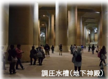
調圧水槽(地下神殿)

今後、「首都圏外郭放水路利活用協議会」と「東武トップツアーズ株式会社」は連携して社会実験を行い、“地下神殿”とも称される調圧水槽をはじめとした『首都圏外郭放水路』の各施設を利活用し、見学会などインフラツーリズムの拡大や、地域活性化を進めていきます。