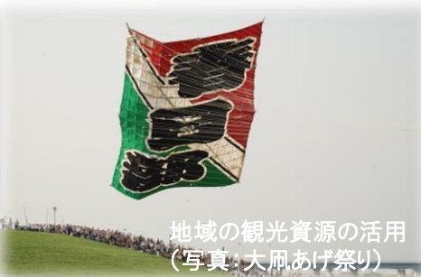
地域の観光資源の活用 (写真:大冨あげ祭り)