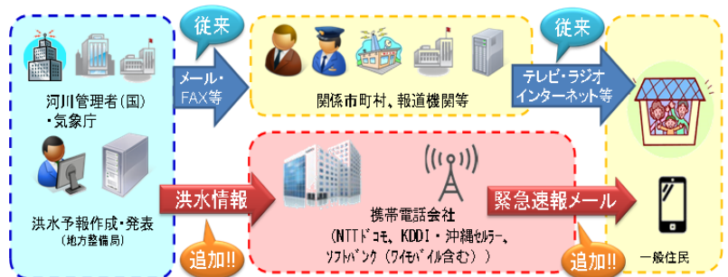
洪水情報の配信イメージ

ワイモバイル : http://www.ymobile.jp/service/urgent_mail/