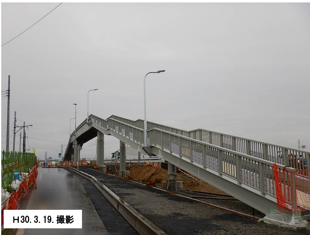
H30. 3. 19. 撮影