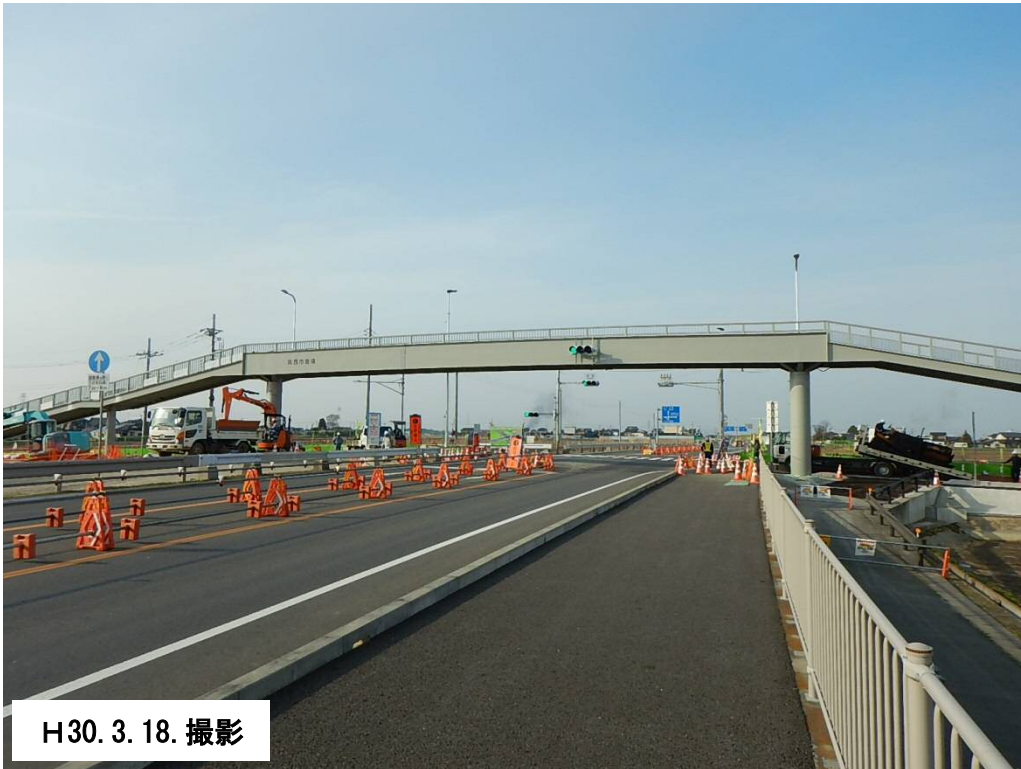
H30. 3. 18. 撮影