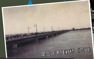
足立区千住新橋 (荒川)