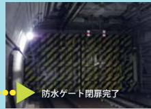
防水ゲート閉扉完了