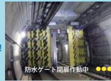
防水ゲート閉扉作動中