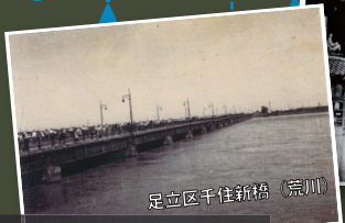
足立区千住新橋（荒川）