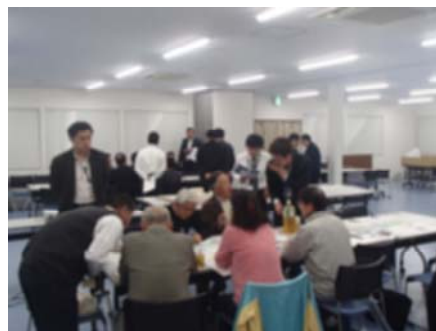
3月5日ワーキングの様子