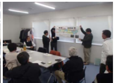
各班代表者によるワーキング成果の発表