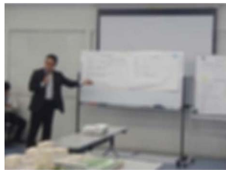
コーディネーターによる意見とりまとめ