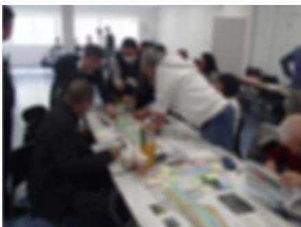
3月3日ワーキングの様子