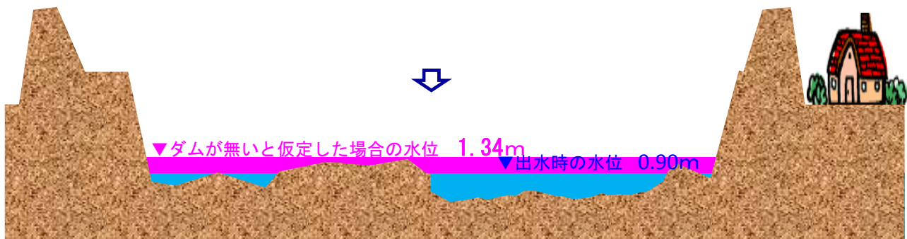
図2 宮ヶ瀬ダムにより想定される水位の低減（才戸橋地点）

※「ダムが無いと仮定した場合の水位」は、当該時刻のダム地点の貯留量をダム下流の中津川才戸橋地点の水位低減量に換算しています。