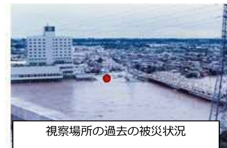
視察場所の過去の被災状況