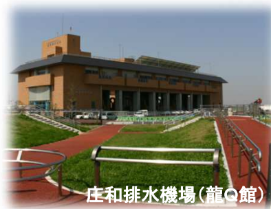
庄和排水機場(龍Q館)