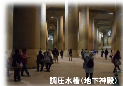
調圧水槽(地下神殿)

日時 平成30年2月15日(木) 10:30～11:30 場所 埼玉県春日部市上金崎720 庄和排水機場(龍Q館) 構成員 別紙1参照 内容 別紙2参照