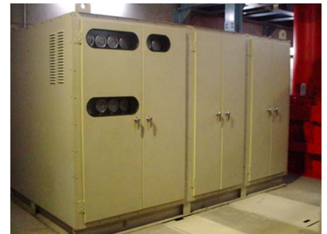
【既設油圧ユニット外観】