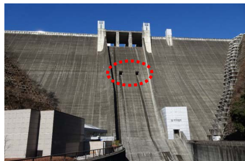
高位常用洪水吐の位置 (囲み部分)