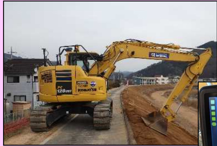
大型モニター で管理