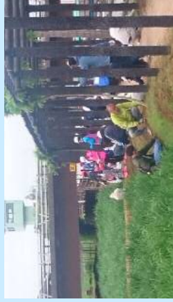
アヤメ、花菖蒲を手入れする様子