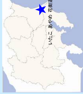
いたこ あやめ 花街道