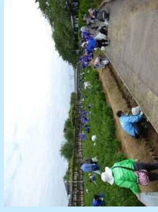
あやめ園整備事業

古来より生息しているアヤメや花菖蒲を守り後世に伝えていくとともに、水郷潮来あやめ園の整備に協力、さらに関係する道路管理者と協力し、地域資源を活かしたイベント等への誘客を促すことにより、潮来の観光振興に寄与することを目的とする。