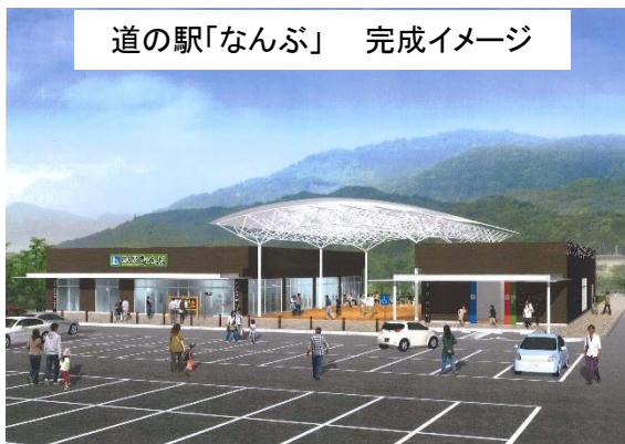
道の駅「なんぶ」完成イメージ