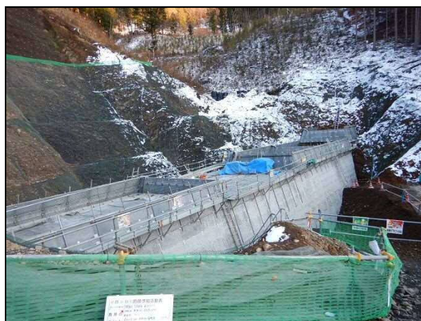
H28柿平沢砂防堰堤工事現場