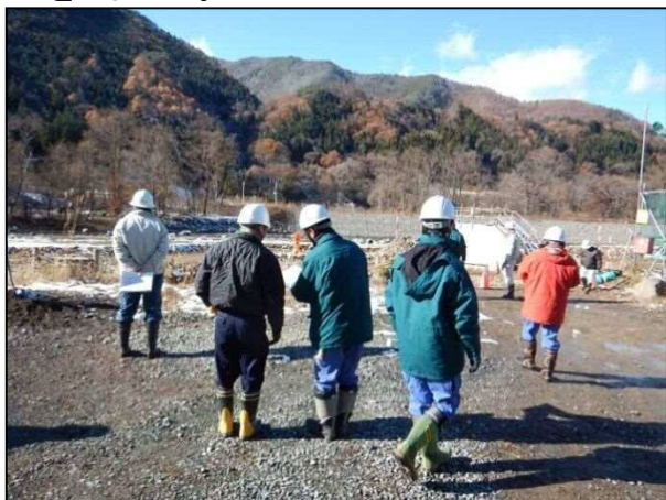
H29越本護岸工工事現場

管内の安全パトロールは月に1度事務所の職員で実施しておりますが、11月は工事事故防止強化月間と定め、労働基準監督署の職員と合同で安全パトロールを実施します。今回のパトロールは稼働中の工事であるH29越本護岸工工事、H29平川流域工事用道路工事、H28柿平沢砂防堰堤工事の3現場をパトロールしました。