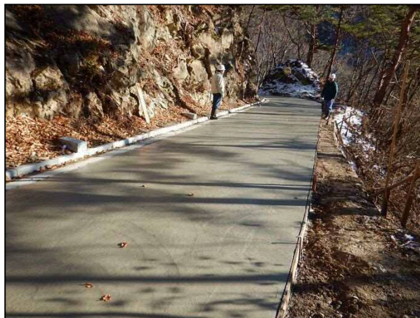
H29平川流域工事用道路工事現場