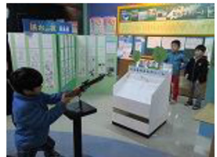
射的ゲームで、外来種に当てよう！