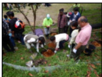
1. 苗木を植える穴を掘ります