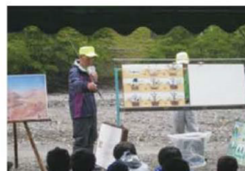
3. 植樹の作業手順の説明