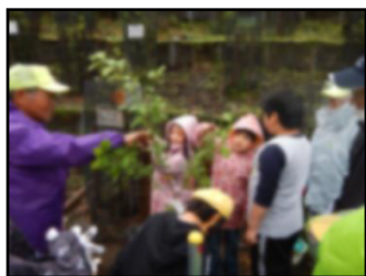
4. 苗木を保護するネットを張ります