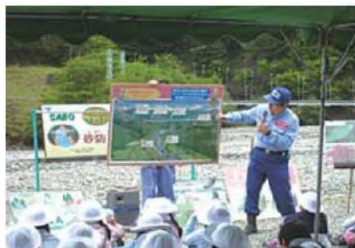
1. 国土交通省職員からの挨拶