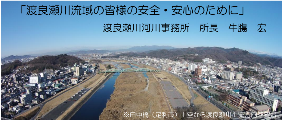
※田中橋（足利市）上空から渡良瀬川土流方向を望む