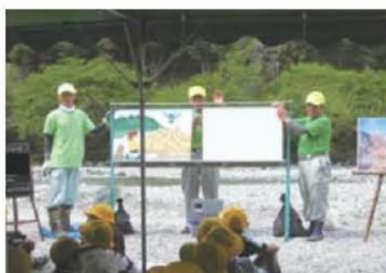
2. 紙芝居による足尾の歴史や砂防事業の説明