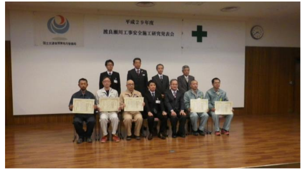
発表された皆さまと審査員

建設工事現場における安全対策と安全施工技術のさらなる向上を目指して、12月14日(木)に「工事安全施工研究発表会」を開催しました。(平成11年度から実施、19回目)