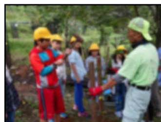
3. 苗木を固定する杭を打ちます