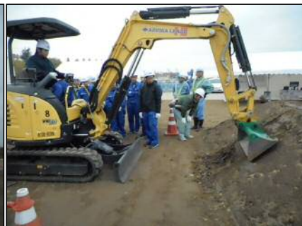
■ MG油圧ショベル操作体験