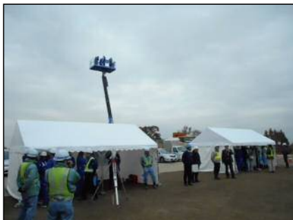
■ 高所作業車乗車体験 ■ TS測量説明