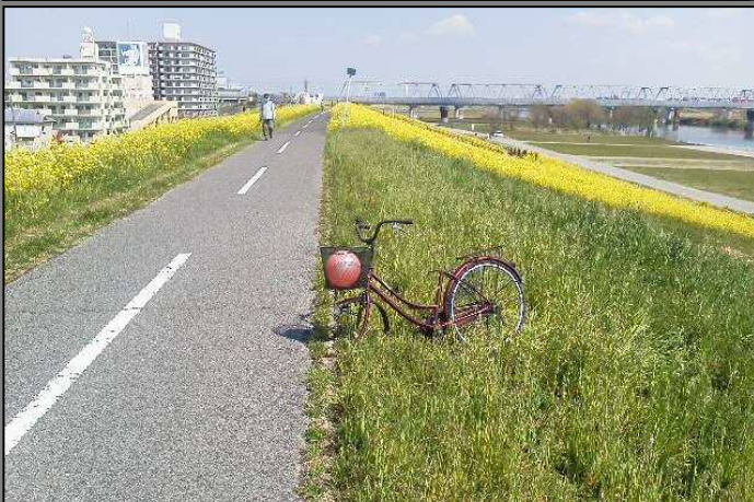
※江戸川右岸26.7km付近(流山橋下流) 前輪とサドルのない自転車