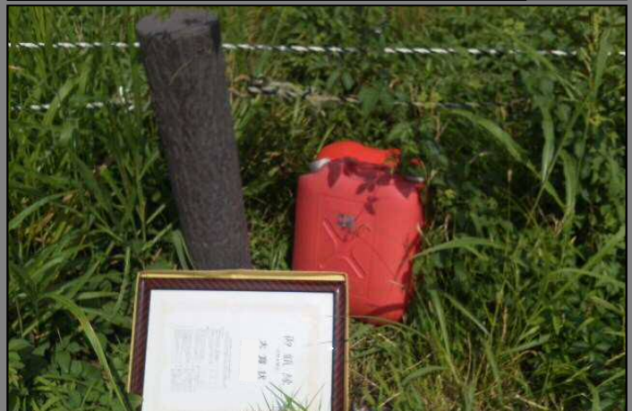
※中川左岸20.8km付近(三郷市戸ヶ崎地先) 額縁に入った表彰状とポリタンク

三郷出張所管内で確認された不法投棄ゴミに関しては、これまでも「三郷出張所だより」にて度々報告させていただいておりますが、依然として大小様々なゴミの投棄が見受けられます。