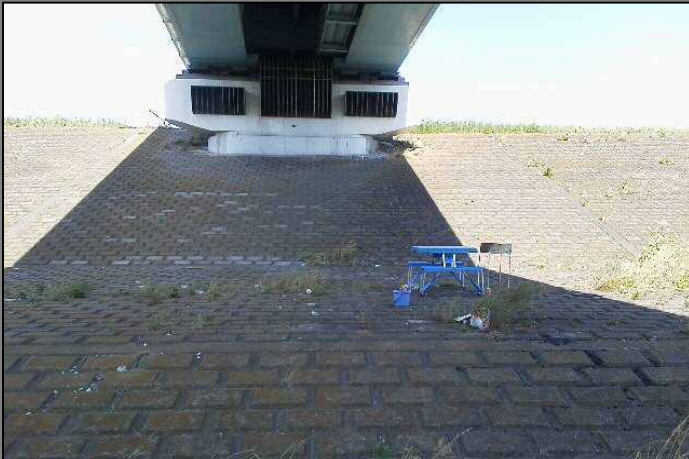
※江戸川右岸21.4km付近(上葛飾橋直下) 折りたたみ式テーブル、バーベキューセット、花火の残骸