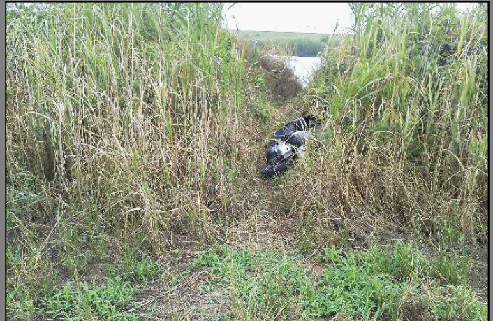
※江戸川右岸21.6km付近(上葛飾橋上流) 乗り捨てられた原付バイク