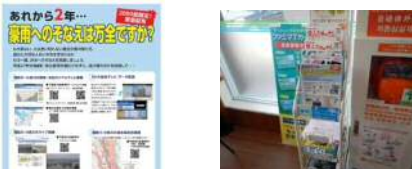
台風期に備えて緊急配布