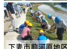
下妻市前河原地区