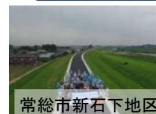
常総市新石下地区