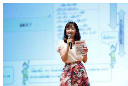
お天気キャスター起用で注目度アップ