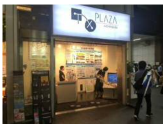
水防災に沿川の魅力も加えて都内で発信