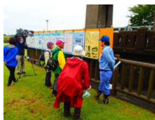
流域内の人が集まるイベントとも連携