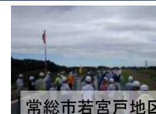
常総市若宮戸地区