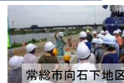
常総市向石下地区