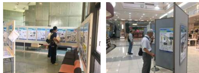
流域各地の人が集まる場所で一斉に実施