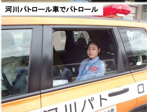
河川パトロール車でパトロール