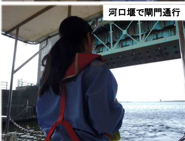
河口堰で閘門通行