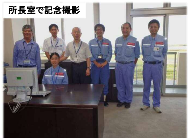
所長室で記念撮影