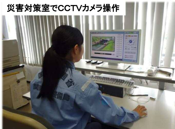
災害対策室でCCTVカメラ操作