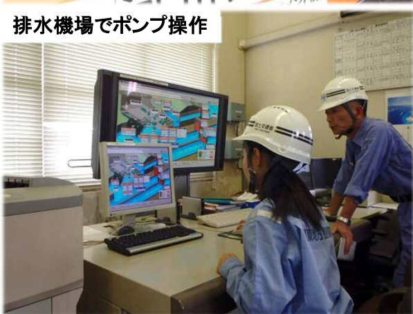
排水機場でポンプ操作