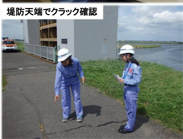
堤防天端でクラック確認