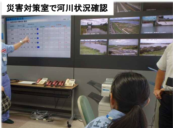
災害対策室で河川状況確認