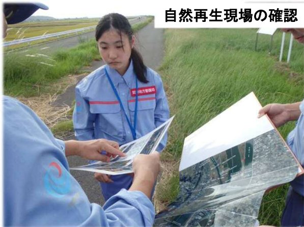
自然再生現場の確認