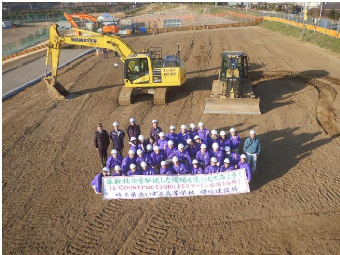
ドローンを使っての記念撮影（埼玉県立いずみ高校）