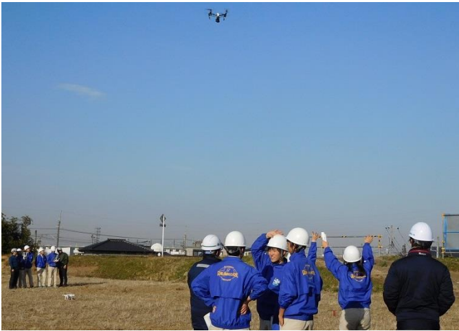
ドローン操縦体験の様子です（埼玉県立いずみ高校）

現場見学会では、ドローンなどを使った3次元（3D）測量やマシンコントロール（MC）バックホウといった ICT 建機を実際に操作し、“建設現場の進化”を実感していただけたのではないのでしょうか。