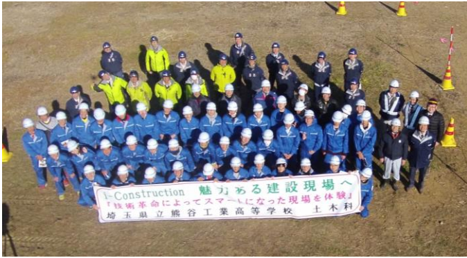
ドローンを使っての記念撮影（埼玉県立熊谷工業高校）