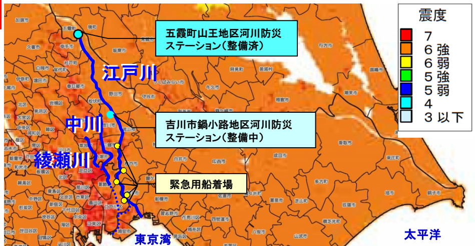
図一 首都直下のM7クラスの地震の重ね合わせた震度分布