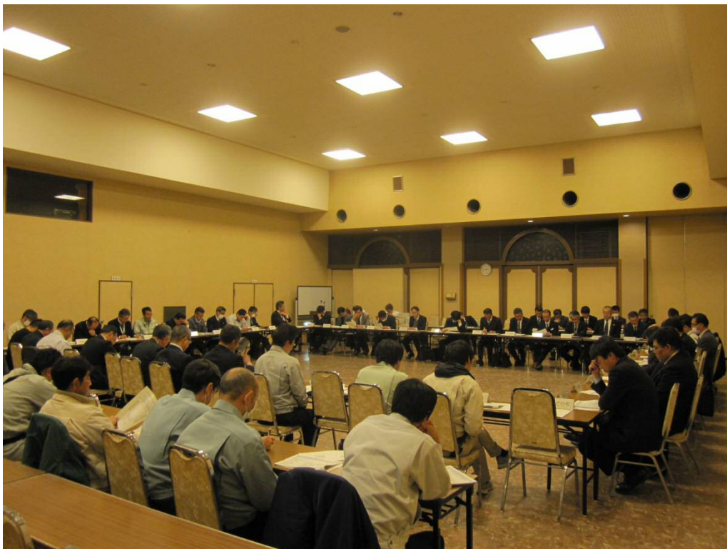
第9回群馬県メンテナンス協議会の実施状況 (平成29年3月7日)