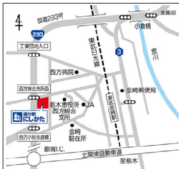
会場案内図（道の駅内に駐車場あり）

※ 報道機関の方で、取材・実験車両への試乗をご希望の方は、9月1日（金）17時までに関東地方整備局 宇都宮国道事務所（TEL 028-638-2181 担当：井上、小野田）までご連絡ください。