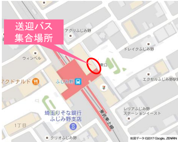
東武東上線ふじみ野駅（東口）