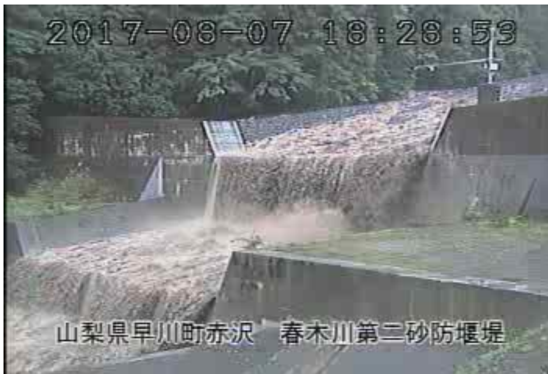
春木川第二砂防堰堤（早川町）（8月7日18時28分頃）