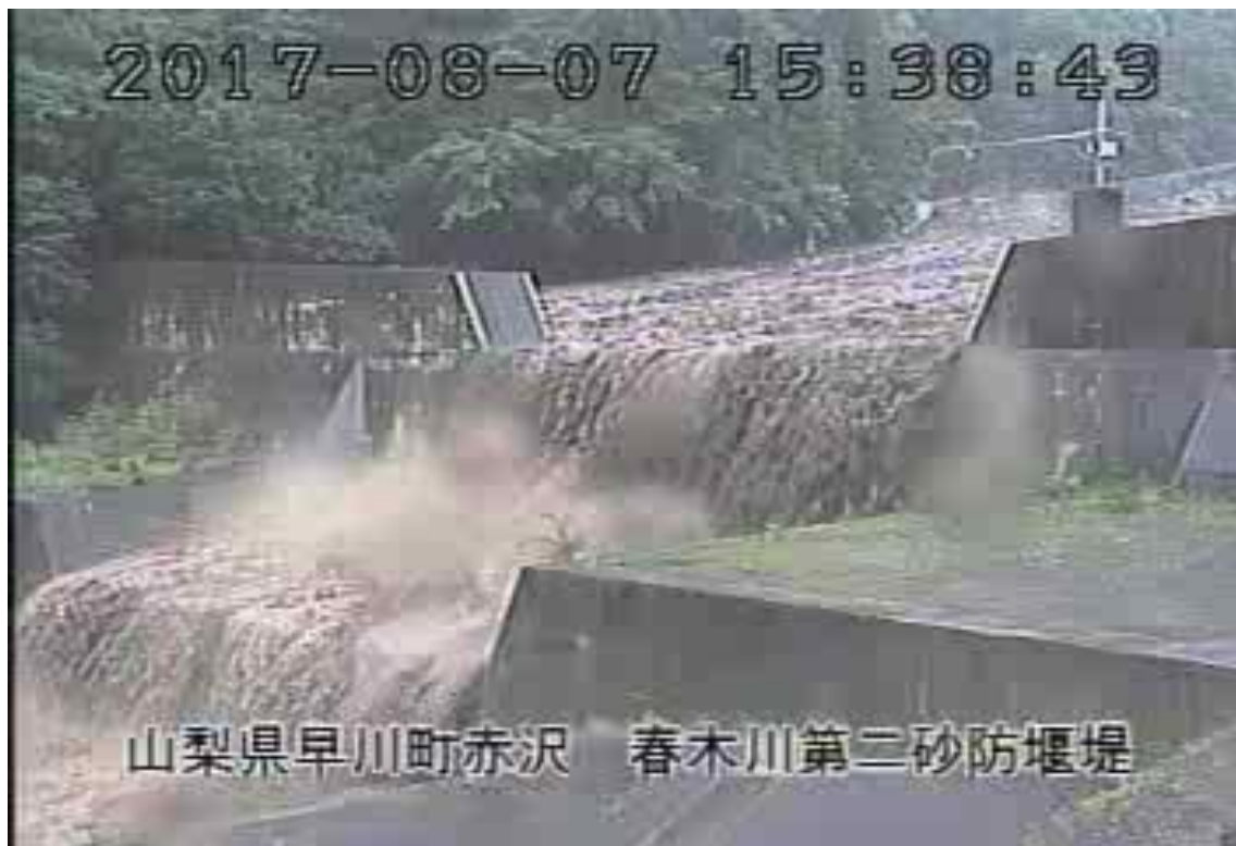
春木川第二砂防堰堤の状況 (8月7日15時38分頃)