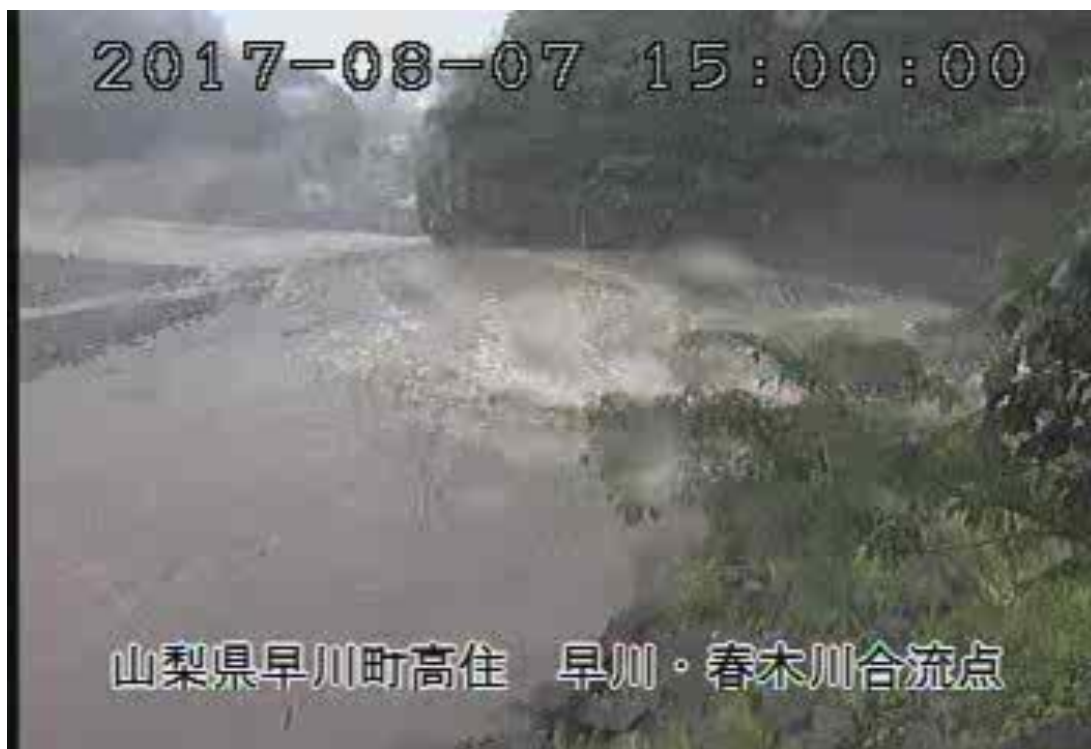
早川・雨畑川合流点（早川町）（8月7日15時00分頃）