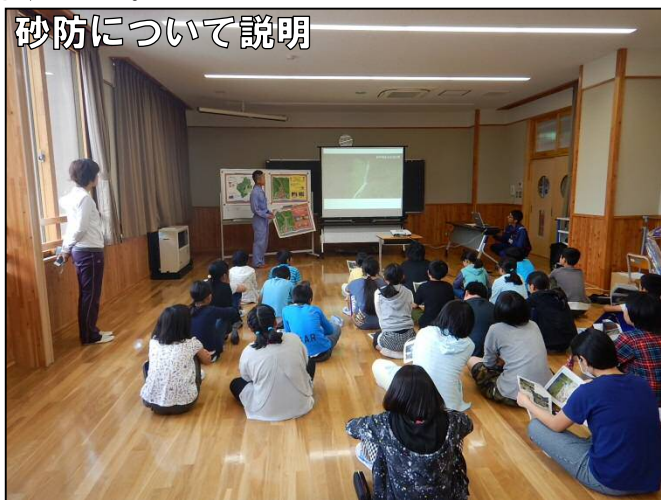
砂防について説明