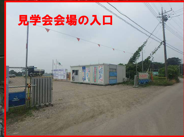
見学会会場の入口