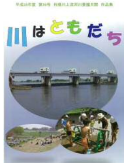
平成28年度 利根川上流河川愛護月間 作品集「川はともだち」

http://www.ktr.mlit.go.jp/tonejo/tonejo00481.html