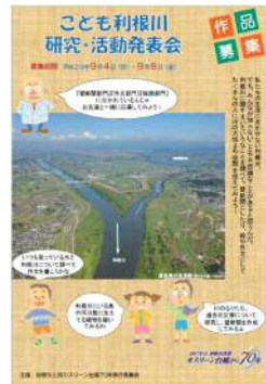
「こども利根川 研究・発表会」作品募集ちらし