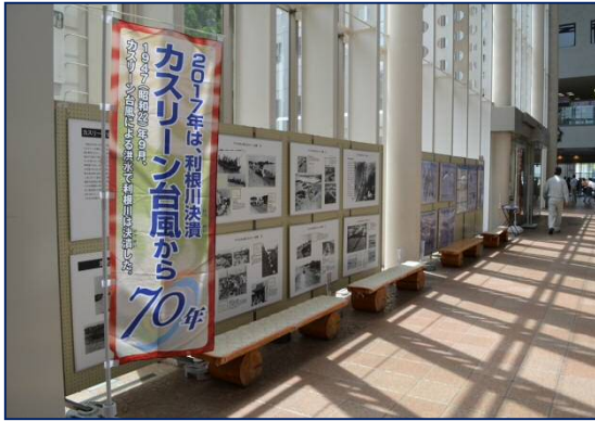
パネル展示の様子 太田市役所（6月14日～20日）

2017年はカスリーン台風から70年目の年になります。地域の方々に水害の恐ろしさ、防災避難の重要性を改めて認識していただくための取り組みとして、利根川上流カスリーン台風実行委員会構成自治体（49市区町）においてパネル展を開催します。5月以降の開催場所等につきましては利根川上流河川事務所HPをご確認下さい。閲覧は無料です。多くの方のご来場をお待ちしております。