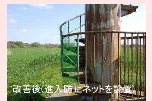
改善後(進入防止ネットを設置)

GW・夏休み前には、河川を訪れた人が安全に利用できるよう点検、補修を行っています。