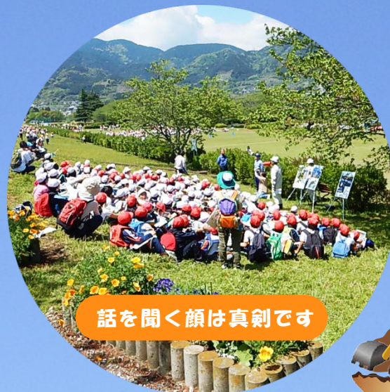
話を聞く顔は真剣です