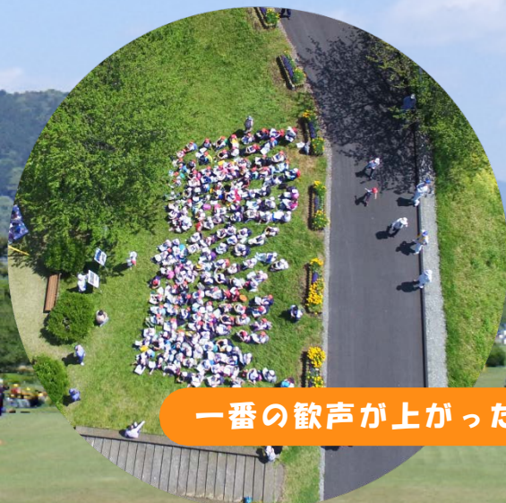
一番の歓声が上がったドローンでの記念撮影