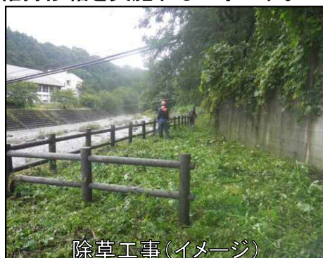
除草工事(イメージ)

平成29年4月に契約となりました。除草工、舗装工及び法面對策工など管内の様々な砂防施設の整備、維持修繕を実施する工事です。