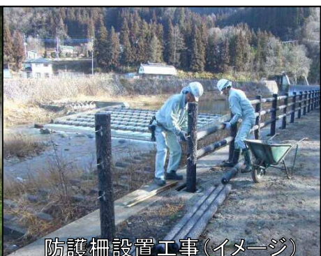
防護柵設置工事(イメージ)