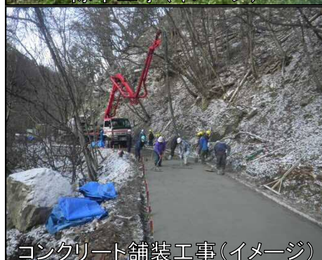
コンクリート舗装工事(イメージ)