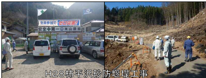
H28柿平沢砂防堰堤工事