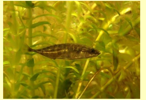
きれいな川のシンボル「ムサシトミヨ」

きれいな小川をすみかとするムサシトミヨは、熊谷市の元荒川の一部にしかいない貴重な魚で「県の魚」に指定されています。