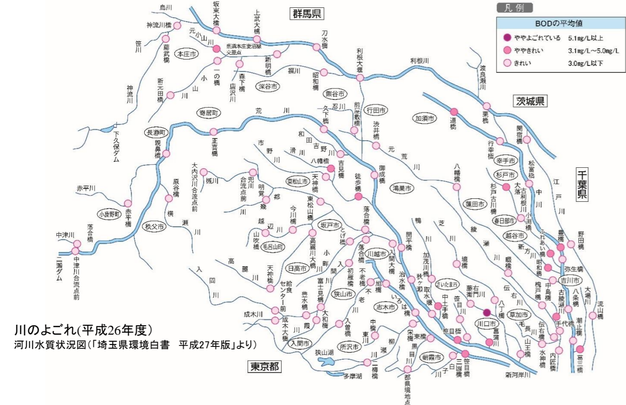
川のごよごれ(平成26年度) 河川水質状況図(「埼玉県環境白書 平成27年版」より)