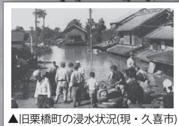
▲旧栗橋町の浸水状況(現・久喜市)