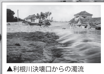
▲利根川決壊口からの濁流