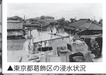
▲東京都葛飾区の浸水状況