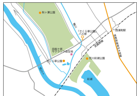
田島ケ原サクラソウ自生地

さくら草公園（田島ケ原サクラソウ自生地） 交通：東武東上線「志木駅」下車、国際興業バス「浦和駅西口」行き「さくら草公園」下車、徒歩約3分 住所：さいたま市桜区田島