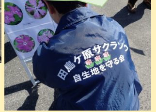
田島ケ原サクラソウ自生地を守る会