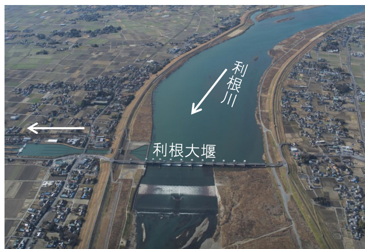
取水口である利根大堰