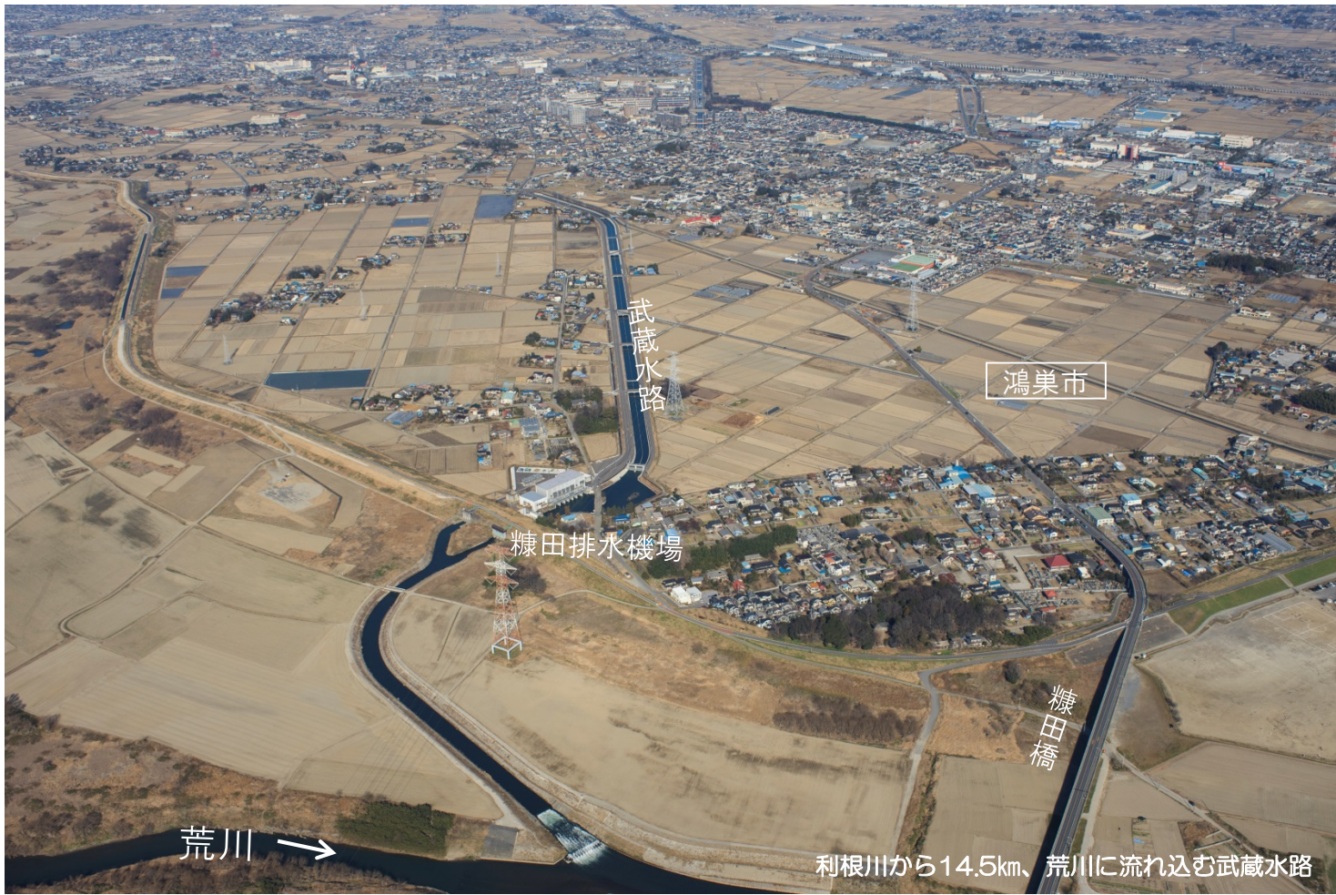
利根川から14.5km、荒川に流れ込む武蔵水路