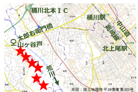
太郎右衛門自然再生地