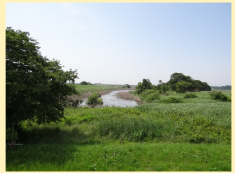
太郎右衛門自然再生地

太郎右衛門自然再生地は、荒川の堤外地（堤防の川側）にあって緑豊かな地域であり、3つの池を中心とした湿地環境が残存しており、湿地環境を改善するための自然再生事業が進められています。