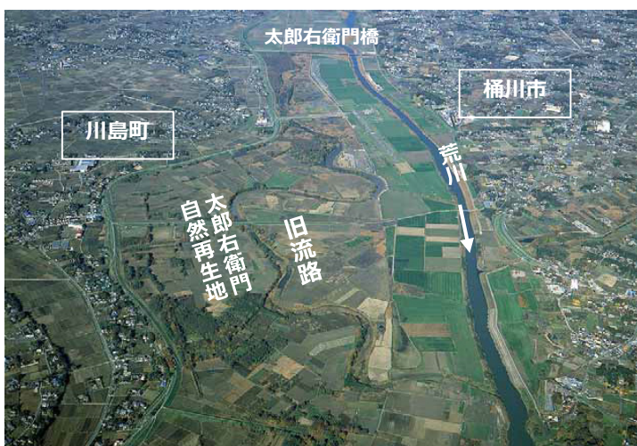
旧流路が池となっている太郎右衛門地区（河口から50～54km付近）