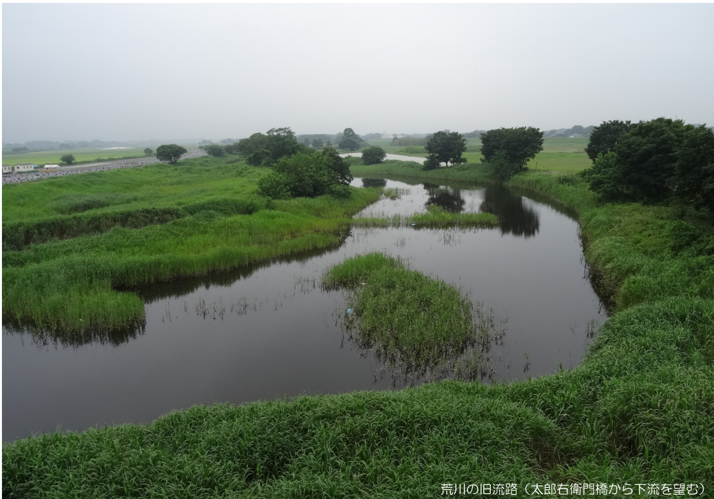
荒川の旧流路（太郎右衛門橋から下流を望む）

荒川の中流域には、旧流路に由来する池や湿地といった自然が比較的多く存在しています。