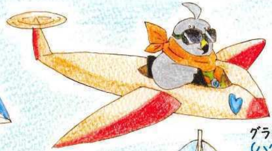
グライダー (ハクト)