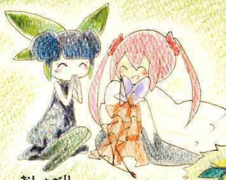
おしゃべり (ハグロ、リリア)