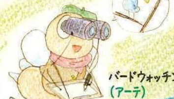
バードウォッチング (アーテ)