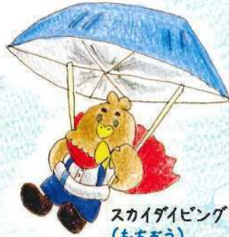
スカイダイビング (もちまう)