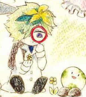
植物・昆虫観察 (オトギリ、テリー)