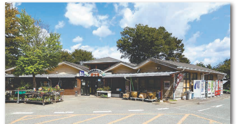
道の駅かつら(城里町)