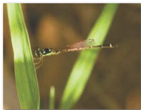
ヒヌマイトトンボ