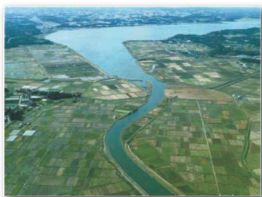
涸沼川周辺の湿地環境