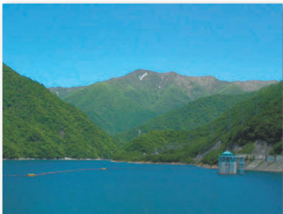
深山ダム(那須塩原市)