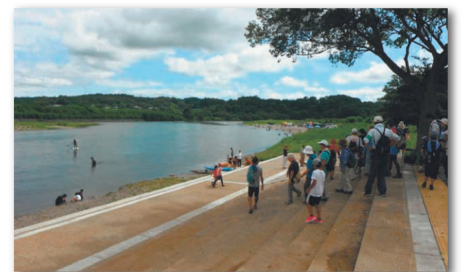
かつら地区でのカヌー利用の様子(城里町)