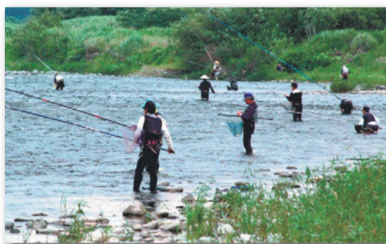
アユ釣り(那須烏山市)