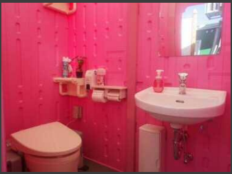
女性専用快適トイレ

女性が働きやすい環境を整えることは、若手や作業員などその他の現場に従事する人にとっても働きやすい環境を提供することに繋がる！！