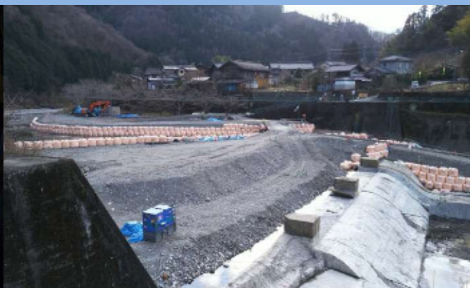
柏木砂防堰堤改良工事