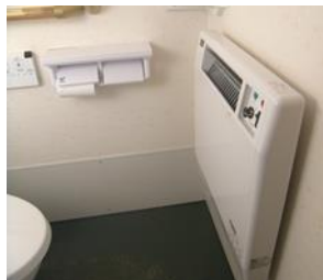
ヒーター付きトイレ