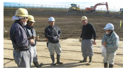
作業員とのコミュニケーション