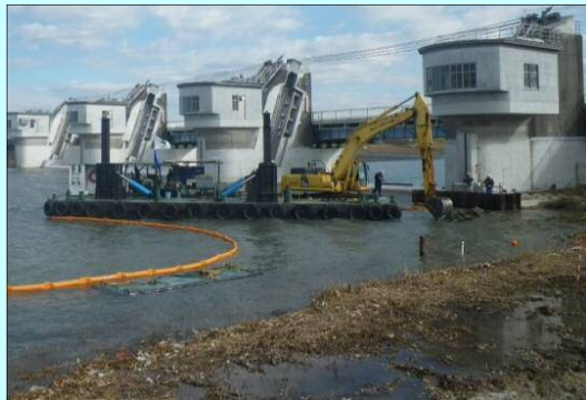
支障になる護岸の撤去状況