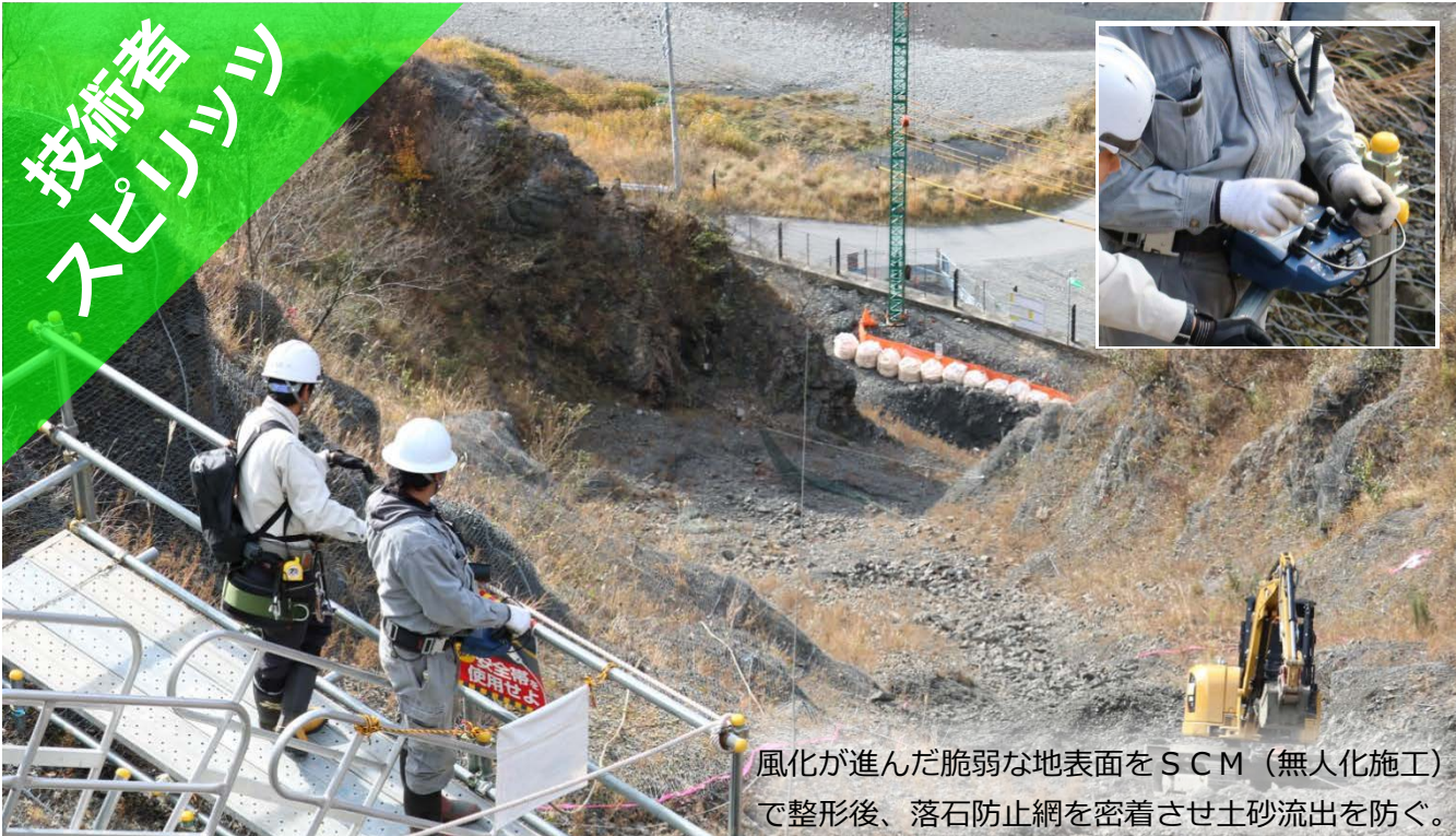
風化が進んだ脆弱な地表面をSCM（無人化施工）で整形後、落石防止網を密着させ土砂流出を防ぐ。

現場は崎嶇なすり鉢状の地形。 墜落・滑落のリスクを排除し続け、 安全確保を最優先で進めることが絶対条件！！