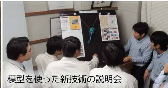
模型を使った新技術の説明会