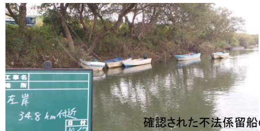
確認された不法係留船の一例

今回10月7日に調査を実施し、25艘の不法係留を確認しました。不法係留船には、その旨を通知する警告書を船体に貼付し、是正指導を行いました。