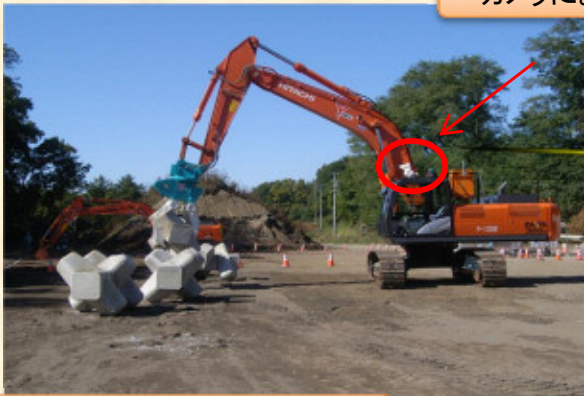
カメラによる映像が送られます