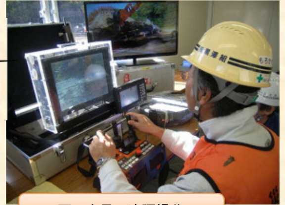
画面を見て遠隔操作

平成28年10月26日(水)長野県北佐久郡御代田町御代田小人過地先において無人化施工機械操作訓練講習会を実施しました。