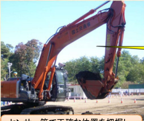
センサー等で正確な位置を把握し掘削作業を行う講習