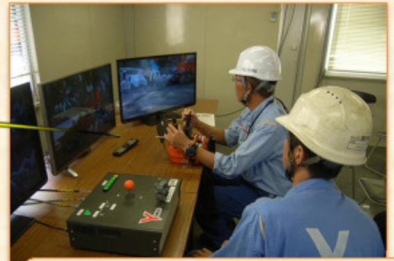
バックホウをカメラからの映像で遠隔操作し危険な場所でも作業が行えます。