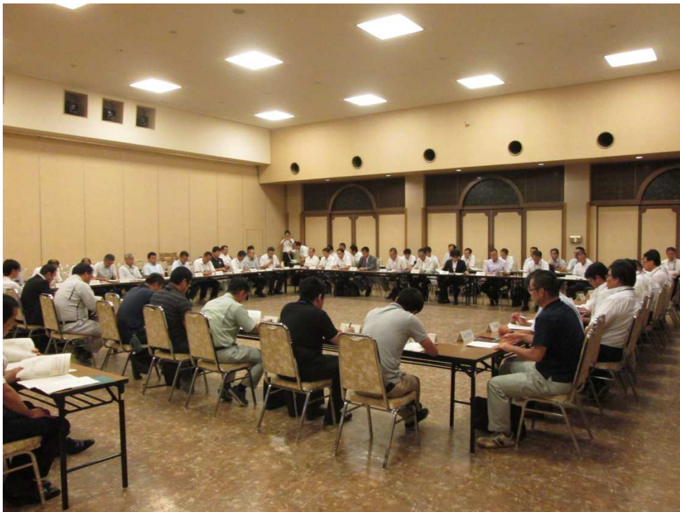
第7回群馬県メンテナンス協議会の実施状況 (平成28年7月12日)