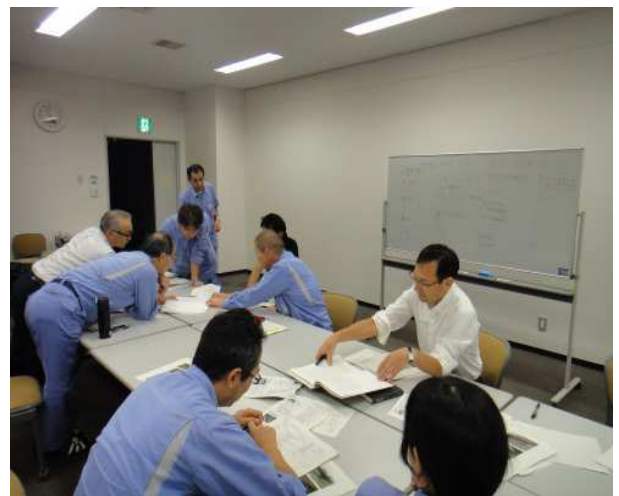
点検結果に基づく診断検討状況