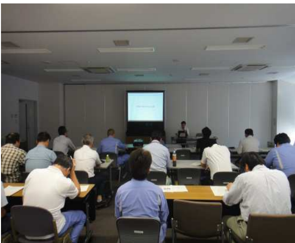
橋梁点検に関する知識を習得するための座学状況

関東地方整備局では、平成28年度から一部の橋梁について職員自らが行う 直営点検・診断 を試行している。