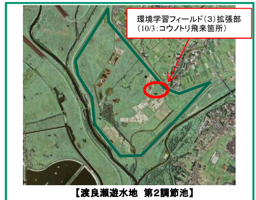
【渡良瀬遊水地 第2調節池】

昨年11月に渡良瀬遊水地エリアエコロジカル・ネットワーク推進協議会を有識者、国、県、関係市町で設立し、『トキやコウノトリも』舞う魅力的な地域づくり』をスローガンに検討部会を開始した矢先のうれしい出来事です。今後の治水と湿地再生の弾み、励みになる出来事で、関係者はもとより、地域の方とも共に喜びを分かち合いました。今後もコウノトリが訪問・営巣できるような取り組みを地域のみなさんといっしょに展開して行きます。