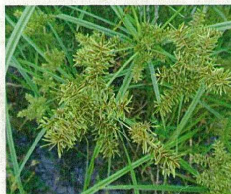
カンエンガヤツリ (絶滅危惧種)