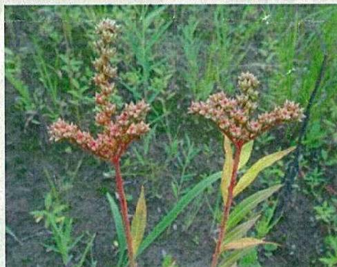
タコノアシ (準絶滅危惧種)