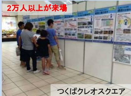
人が集まる場所でパネル展示