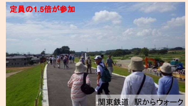
常総市内を巡るウォーキングイベント開催

鬼怒川・小貝川下流域大規模氾濫に関する減災対策協議会 「水防災意識社会」の再構築を目指します。