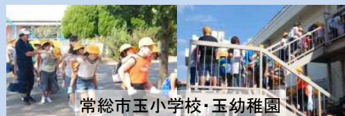
常総市の全小中学校で訓練