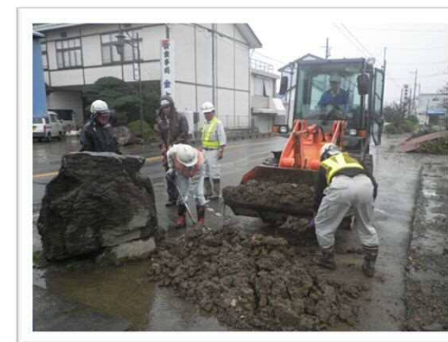
常総市新石下地区