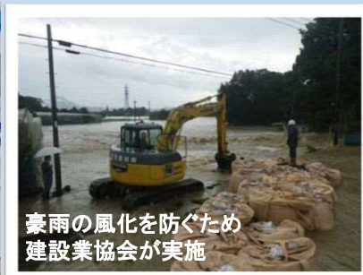
復旧記録写真を併設