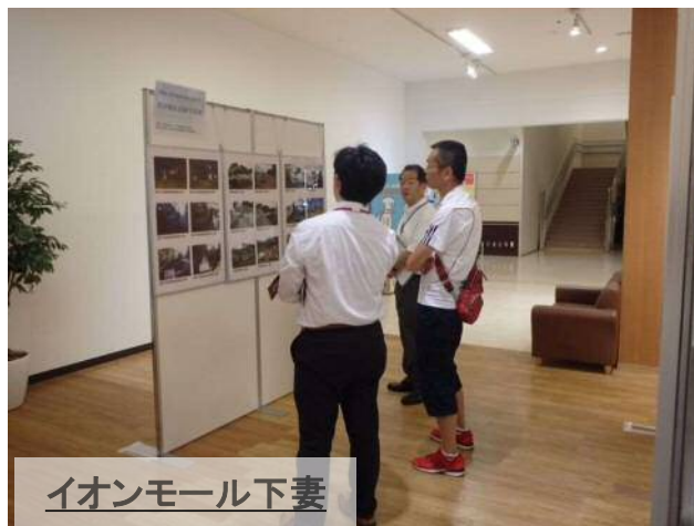
イオンモール下妻