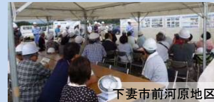
地域住民に工事進捗状況を説明