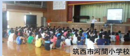
生徒・児童への防災教育