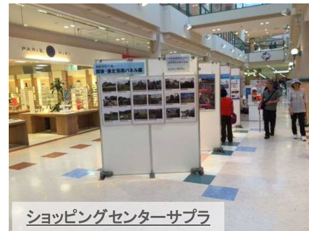
ショッピングセンターサプラ