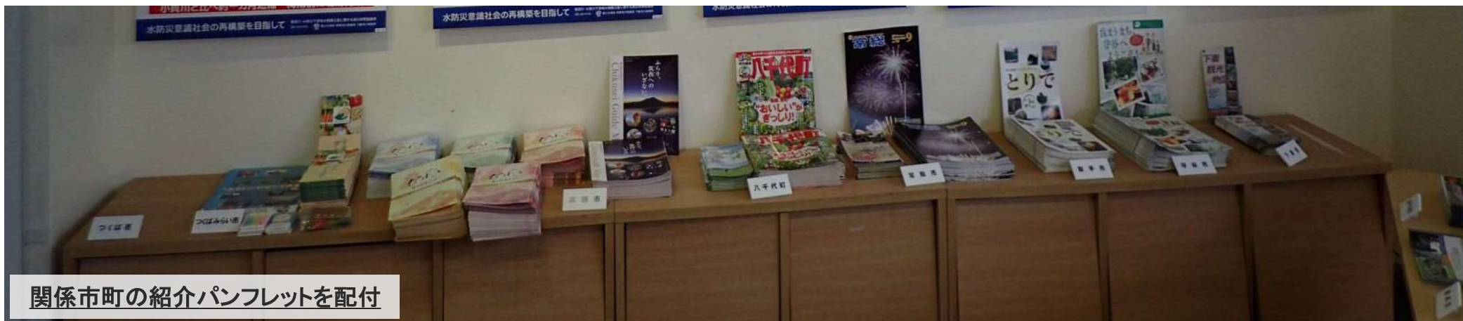
関係市町の紹介パンフレットを配付