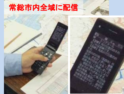
緊急速報メールの配信訓練