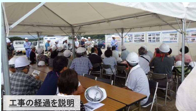
工事の経過を説明