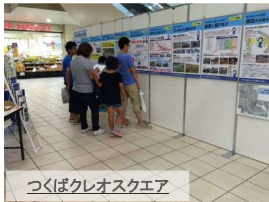
つくばクレオスクエア