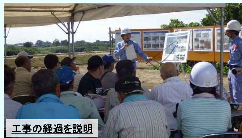
工事の経過を説明