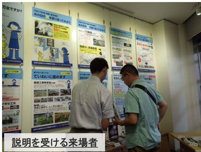
説明を受ける来場者