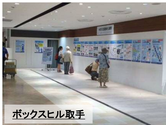
ボックスヒル取手