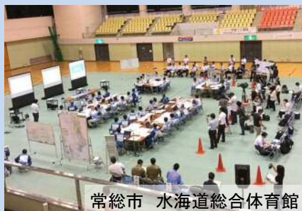
関係者約100名の参加により 洪水時の情報伝達を演習