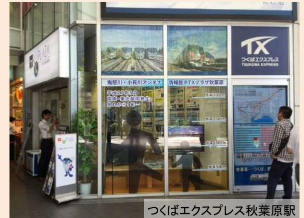
鬼怒川・小貝川アンテナ情報館を開設