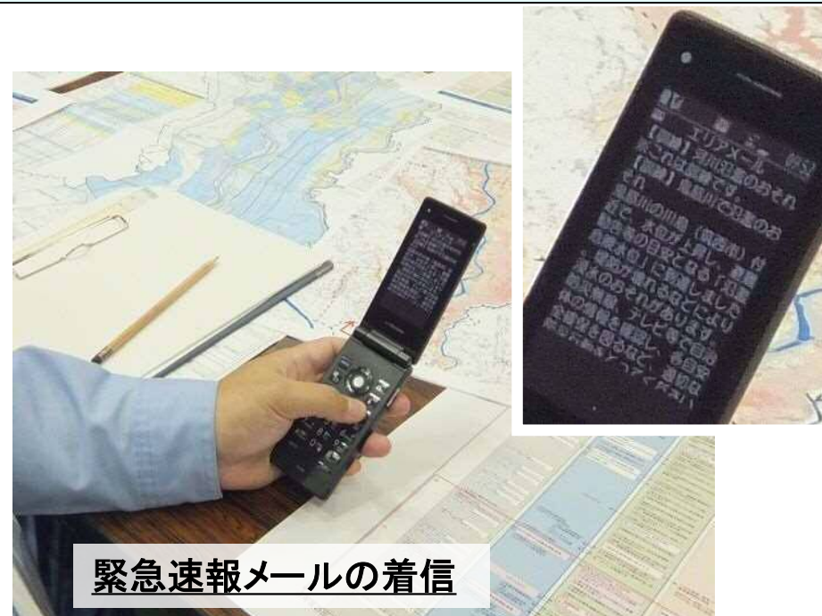
緊急速報メールの着信