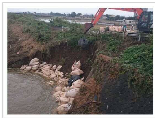
常総市平町八間堀川