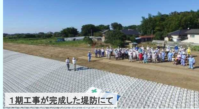
1期工事が完成した堤防にて