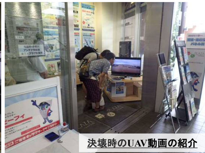
決壊時のUAV動画の紹介