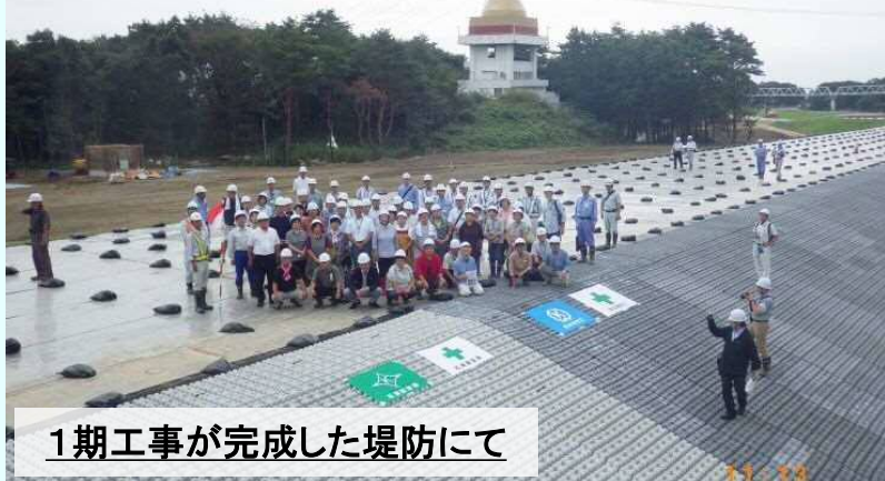
1期工事が完成した堤防にて