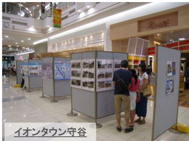
イオンタウン守谷

【協力】: あけの元気館、イオンタウン守谷、イオンモール下妻、ショッピングセンターサプラ、つくばクレオスクエア (五十音順)