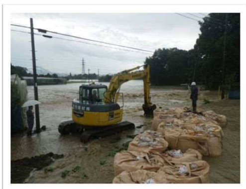
下妻市前河原地区