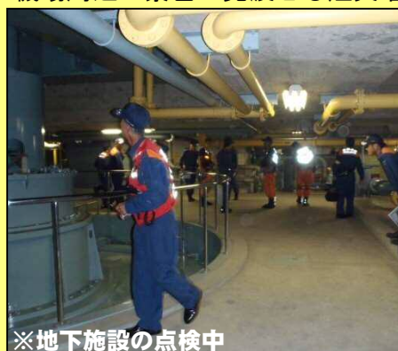
※地下施設の点検中