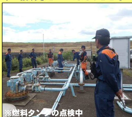
※燃料タンクの点検中

なお余談ですが、立入検査のあと少しお時間をいただき、三郷排水機場(三郷放水路)の施設概要を簡単に説明させていただくとともに、機場周辺の景色が見渡せる煙突塔にも登っていただきました。