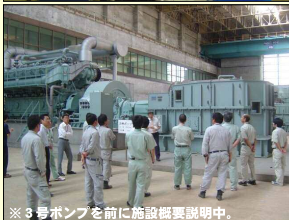
※3号ポンプを前に施設概要説明中。