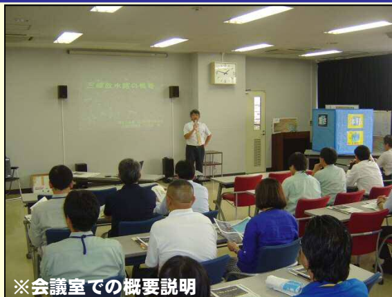
※会議室での概要説明

そこで、三郷市に在籍する職員の方を対象に、三郷排水機場(三郷放水路)の概要を説明するとともに、機場内部にある各施設をつぶさに見ていただき、この機場が綾瀬川や中川といった他の都市河川と連携して、いかに洪水被害の軽減に貢献しているのか、また施設維持の必要性がどれだけ大切であるかといった点を再認識してもらうことで、この三郷排水機場(三郷放水路)の存在意義を高めてもらうことが出来たのではないかと強く感じています。