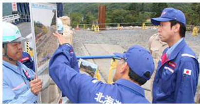
【9月14日】台風第10号により大きな被害が発生した日高町千栄…